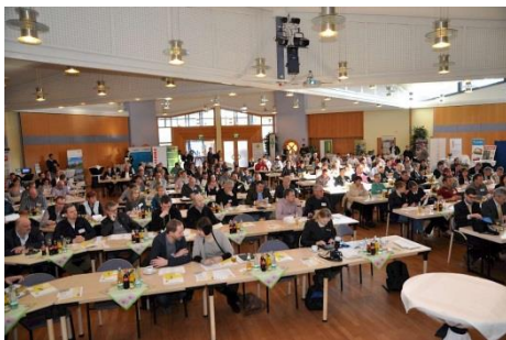
Großer Saal / Tagungsbestuhlung