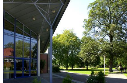
Forum Melle / Eingangsbereich