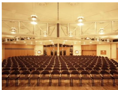
Großer Saal / Konzertbestuhlung