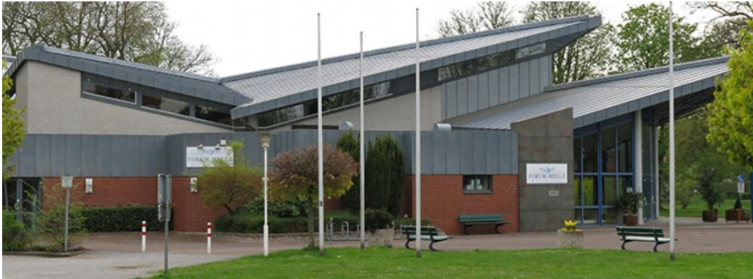
Forum Melle / Außenansicht