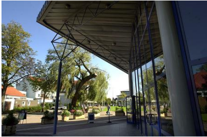
Forum Melle / Eingangsbereich