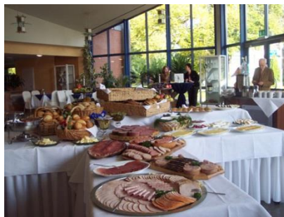
Foyer / Bewirtungsbeispiel